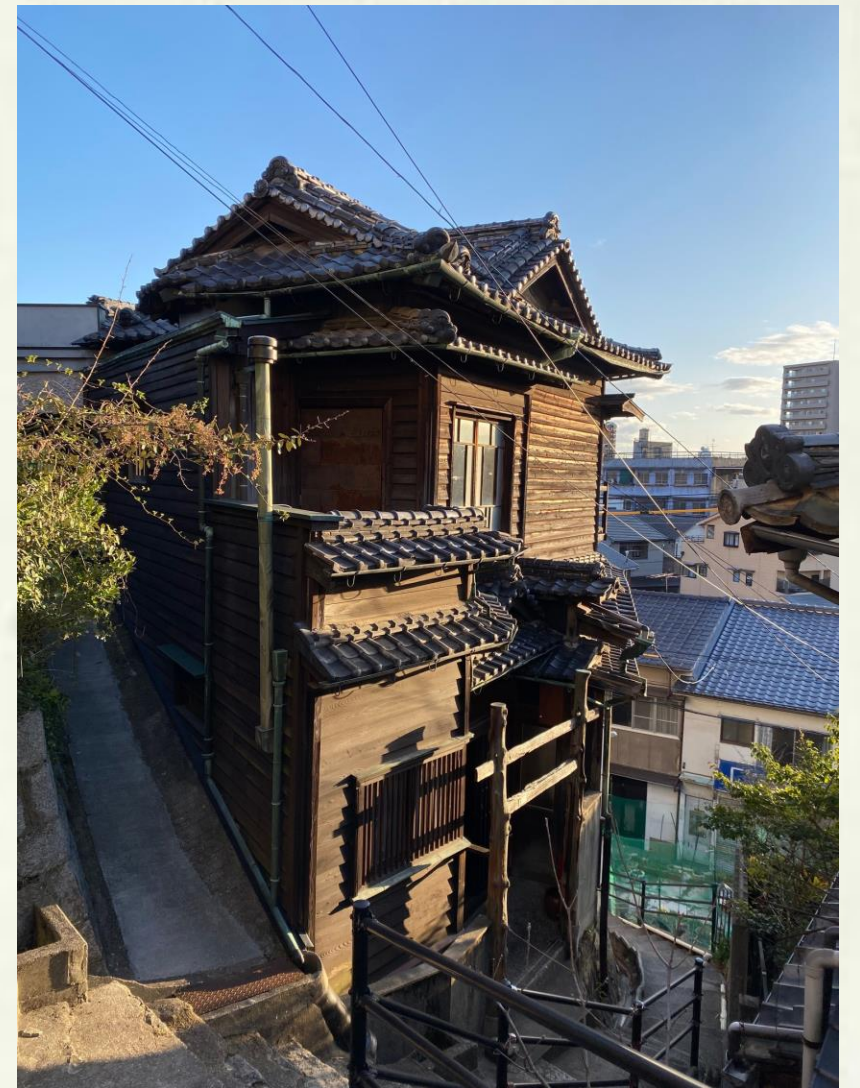
空き家再生第1号物件 旧和泉屋別邸 「尾道ガウディハウス」 25年の空き家期間を経て、プロジェクトによる再生が始められ、活動のシンボルに。

空き家や廃校、様々な地域資源を見事に再生されております。今回の経験を宮内摂田屋に大いに活かしてまいりたいと思います！百聞は一見にしかず。素敵なお縁をいただきました。