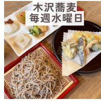
木沢蕎麦 毎週水曜日