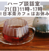
ハーブ談話室 21(日)11時-17時 ※日本茶カフェはお休み