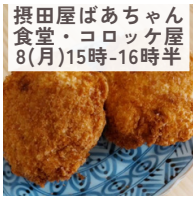
摂田屋ばあちゃん 食堂・コロッケ屋 8(月)15時-16時半