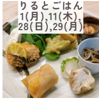
りとごはん 1(月),11(木), 28(日),29(月)

その他にパン教室や郷土料理教室、耳つぼセラピーなども開催！ 詳細はInstagramをご覧ください。