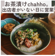
お茶漬けchahho。 出店者がいない日に営業